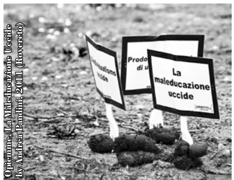
Opipenne, La Maleducazione Uccide by Andrea Pandini, 2011 (Rovereto)