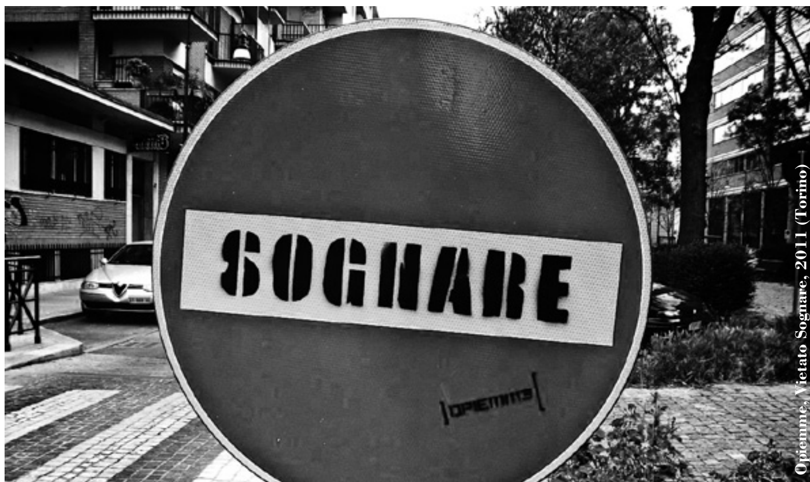
Opieemme, Vietato Sognare, 2011 (Torino)