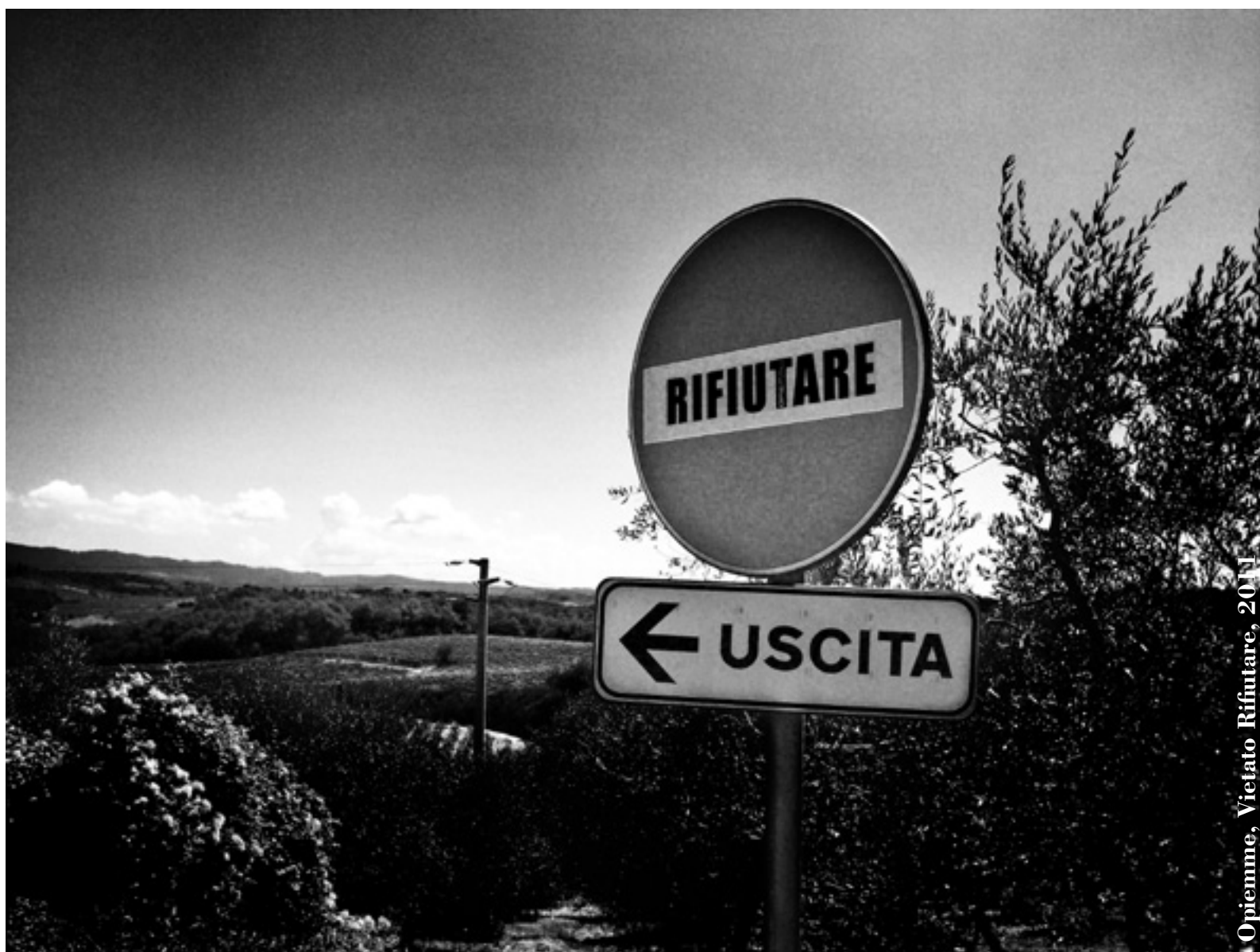
Opiemme, Vietato Rifiutare, 2011