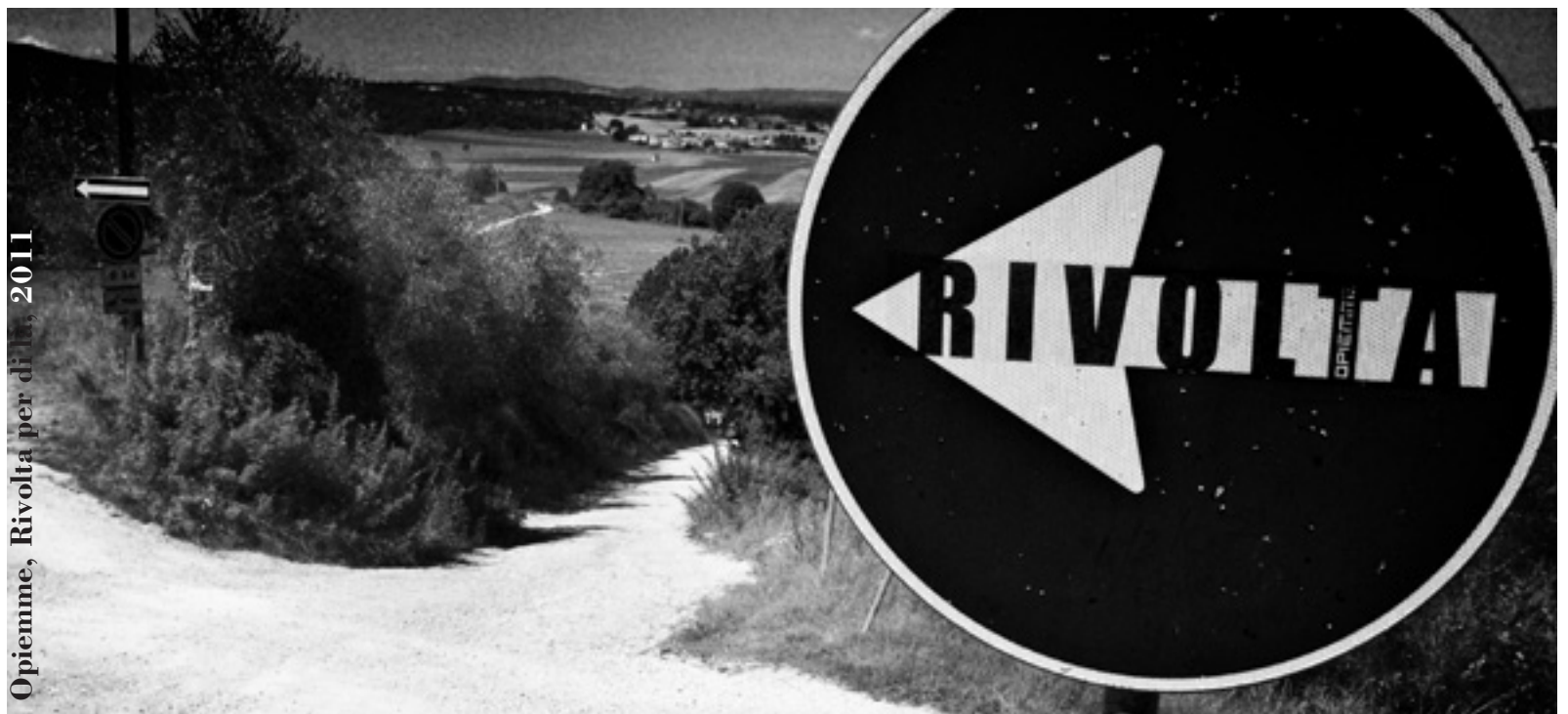
Opieemme, Rivolta per di lu, 2011